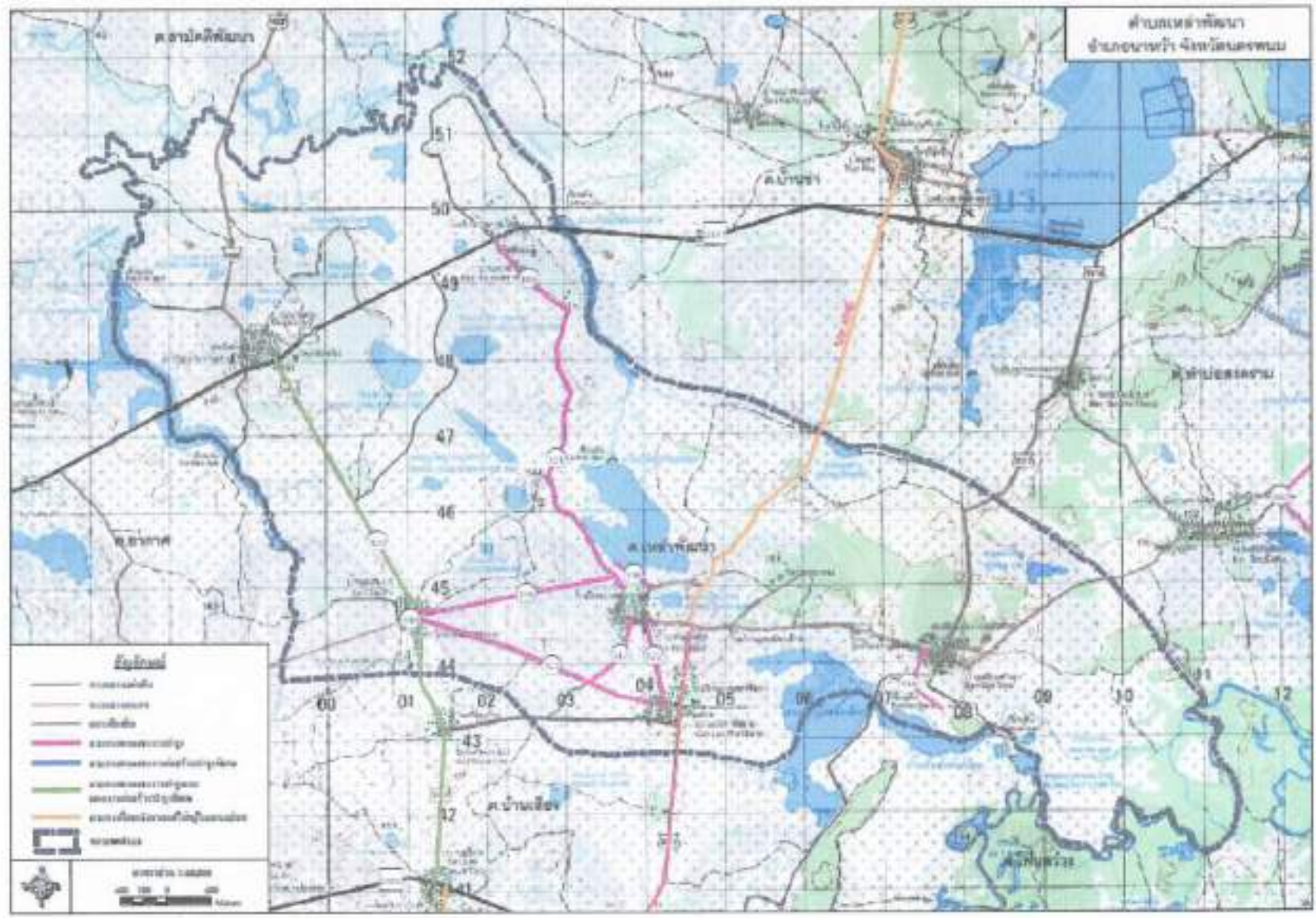
แผนพัฒนาที่ดิน(พ.ศ.๒๕๖๖-๒๕๗๐) เพิ่มเติม ครั้งที่ ๑/๒๕๖๘ องค์การบริหารส่วนตำบลเหล่าพัฒนา อำเภอนาพัว จังหวัดนครพนม