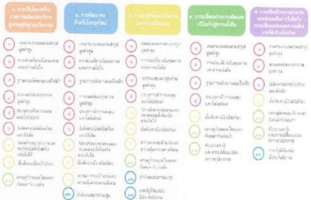
แผนภาพที่ ๓.๕ ความเชื่อมโยงระหว่างกลุ่มยุทธศาสตร์พัฒนากับเป้าหมายหลัก

ไปพร้อมๆ กัน ทำให้จุดหมายแต่ละประการสามารถสนับสนุนเป้าหมายหลักได้มากกว่าหนึ่งข้อ นอกจากนี้ การพัฒนาภายใต้แต่ละจุดหมายไม่ได้แยกขาดจากกัน แต่มีการสนับสนุนหรือเอื้อประโยชน์ซึ่งกันและกัน