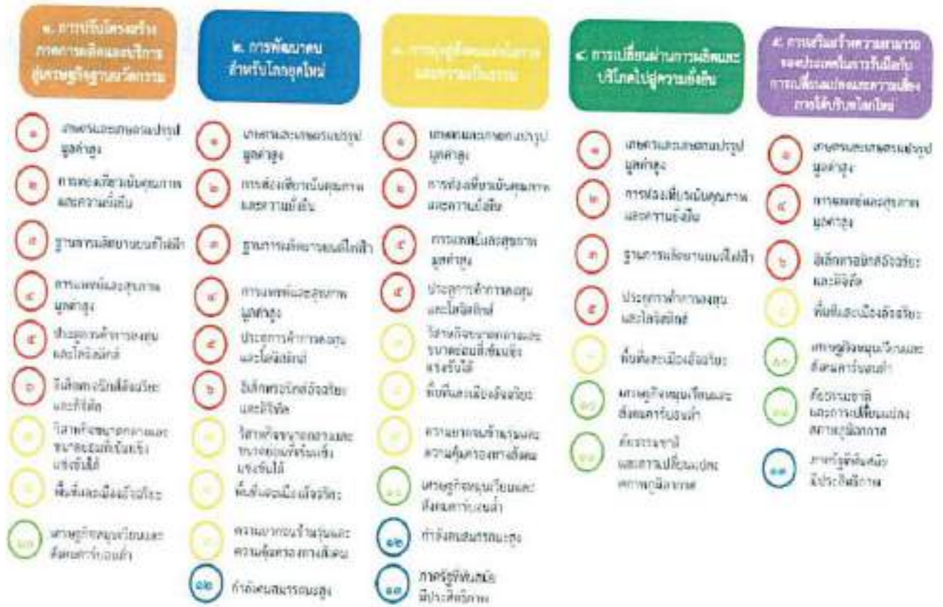
แผนภาพที่ ๓.๑ ความเชื่อมโยงระหว่างหมุดหมายการพัฒนากับเป้าหมายหลัก

ไปพร้อมๆ กัน ทำให้หมุดหมายแต่ละประการสามารถสนับสนุนเป้าหมายหลักได้มากกว่าหนึ่งข้อ นอกจากนี้ การพัฒนาภายใต้แต่ละหมุดหมายไม่ได้แยกขาดจากกัน แต่มีการสนับสนุนหรือเอื้อประโยชน์ซึ่งกันและกัน