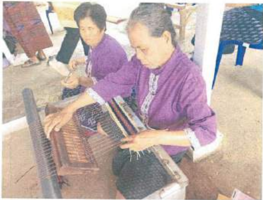
ผลิตภัณฑ์จากกก