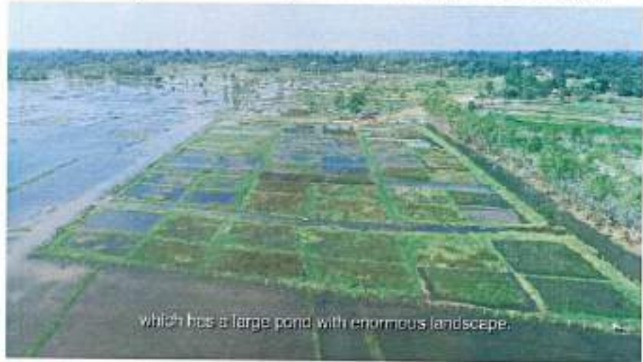
which has a large pond with enormous landscape.

พื้นที่บางส่วนแบ่งไว้ปลูกคั้นกกซึ่งเป็นวัตถุดิบในการผลิตสินค้า OTOP ของชุมชน