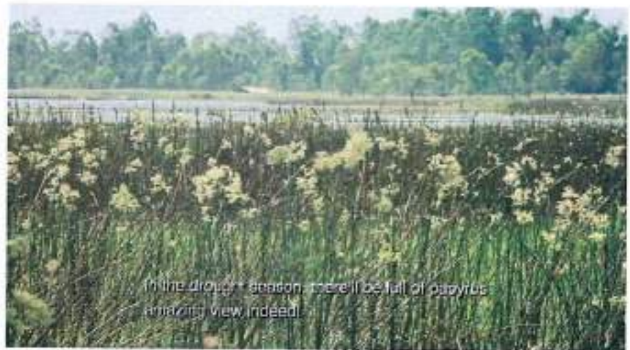
In the drought season, there'll be full of papyrus Amazing view indeed!